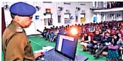
जैन कॉलेज में संमिनार को संबोधित करते एरसी।

कि संभवतः 15 मार्च से जिले के लोगों को इसका लाभ मिलने लगेगा। अब कैरेक्टर सर्टिफिकेट बनाने के लंबी क्लार में खड़ा होने की आवश्यकता नहीं पड़ेगी। आवेदक के मोबाइल फोन पर मैमेज आइया। जिसके बाद अभ्यासी धाने में जबरन अपना मतलबन कराएंगे। कैरेक्टर सर्टिफिकेट बन जाने के बाद भी मोबाइल पर मैमेज आइया कि आन्क्य सर्टिफिकेट बन चुका है। सिर्फ मुहर लगाने के लिए एसपी कार्यालय आना होगा। संमिनार में साइबर क्राइम, सोशल मीडिया और आर्थिक अपराध, विषय पर कैरेक्टर के मायम से एप पर इंस्ट्रेशन भी दिखाया। अगे केले-अहूत सबसे ज्यादा फेसबुक पर फॉलोपर अपने देना के ही लोग है।