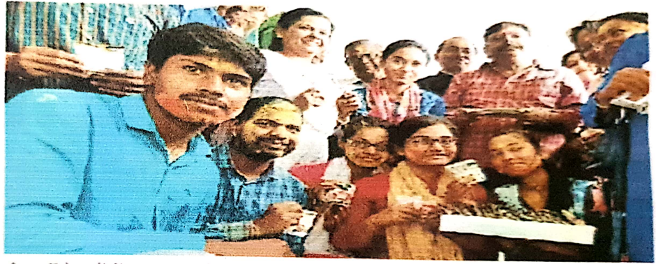
जैन कॉलेज में गेंदा व गुलाब के फूल से रंग बनाकर होली खेलते छात्र-छात्राएं